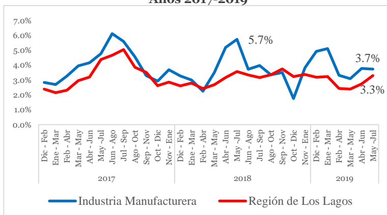
Gráfico 2: Evolución tasa de cesantía y ocupados. Años 2017-2019

Fuente: Elaboración propia conforme a datos ENE (Encuesta Nacional de Empleo) 2017-2019